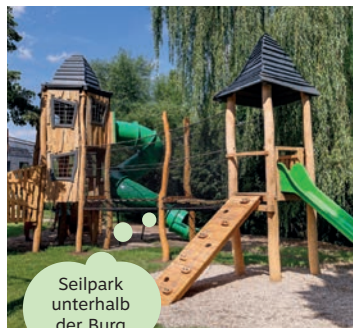
Seilpark unterhalb der Burg