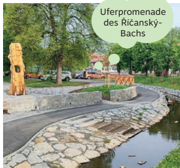
Uferpromenade des Říčanský- Bachs